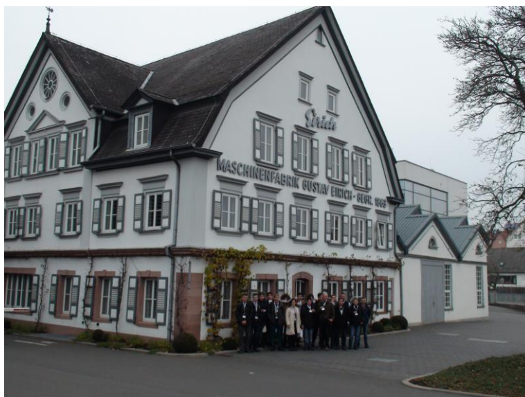
Az alapításkori épület

Családi vállalkozásként Gustav Eirich 1863-ban alapította, és a mai napig is családi kézben van. A gyártás beton és téstakeverőgépek készítésével indult. Ma már 6 kontinensen, 14 országban, 1.400 alkalmazottal dolgoznak. Nyolc helyen van együtt a gyártás, értékesítés és szerviz. Terméskálájuk kibővült pl. 1 literestől 12.000 l-ig; illetve az 1.500 tonnás érckeverőig terveznek és gyártanak.