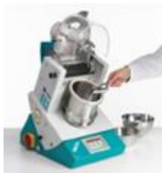
Keverők kicsiben és nagyban